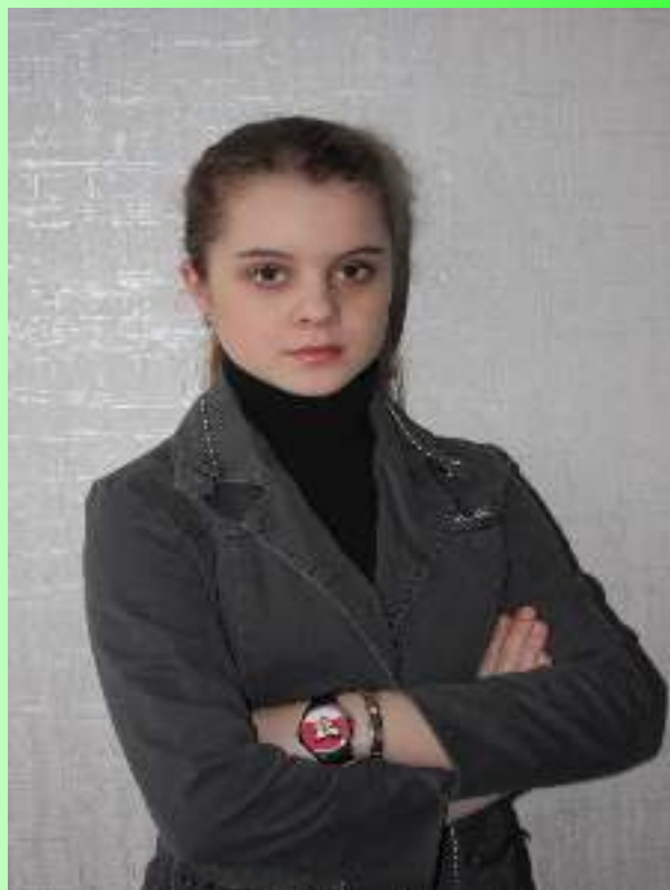
Презентация «Военная история одного солдата» 3 место.

Региональный этап Открытого конкурса интерактивных работ школьников «Сохраним историческую память о ветеранах и защитниках нашего Отечества», посвященного 70-летию Великой Победы