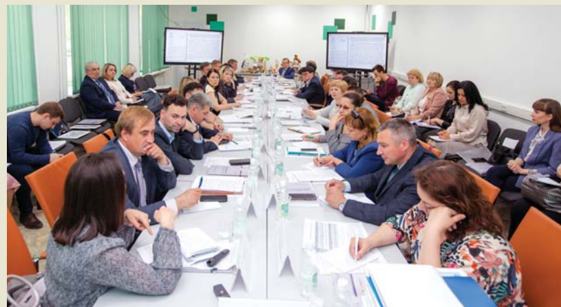
Заседание совета директоров СПО

Ещё на совещании обсуждали реализацию регионального проекта «Патриотическое воспитание граждан Российской Федерации» и увеличение охвата студентов, вовлеченных в мероприятия и проекты патриотической направленности, а также орга-