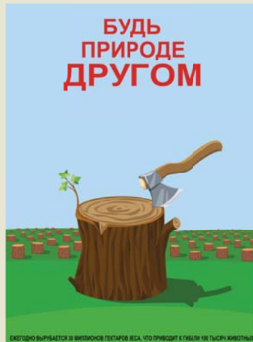
Плакат, Александр МАРЧЕНКО