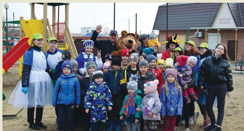
Малышам радостно, когда рядом с ними старшие друзья

Ребята из студсовета и Little-совета техникума желанные гости на городских детских площадках. Очередной раз они побывали у малышей и провели игры на экологическую тему и показали театрализованное представление «В начале было Слово», ко-