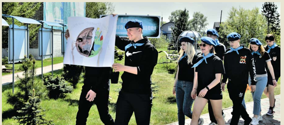
Победный марш «Экодесанта» из школы №1