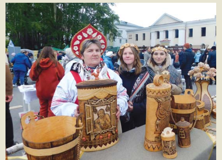
Выставочный ряд мастера С.М. Масанкиной