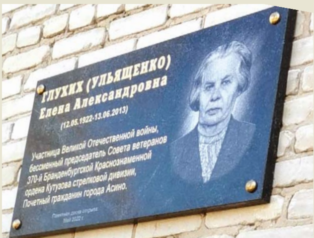
Мемориальная доска закреплена на стене второго корпуса техникума