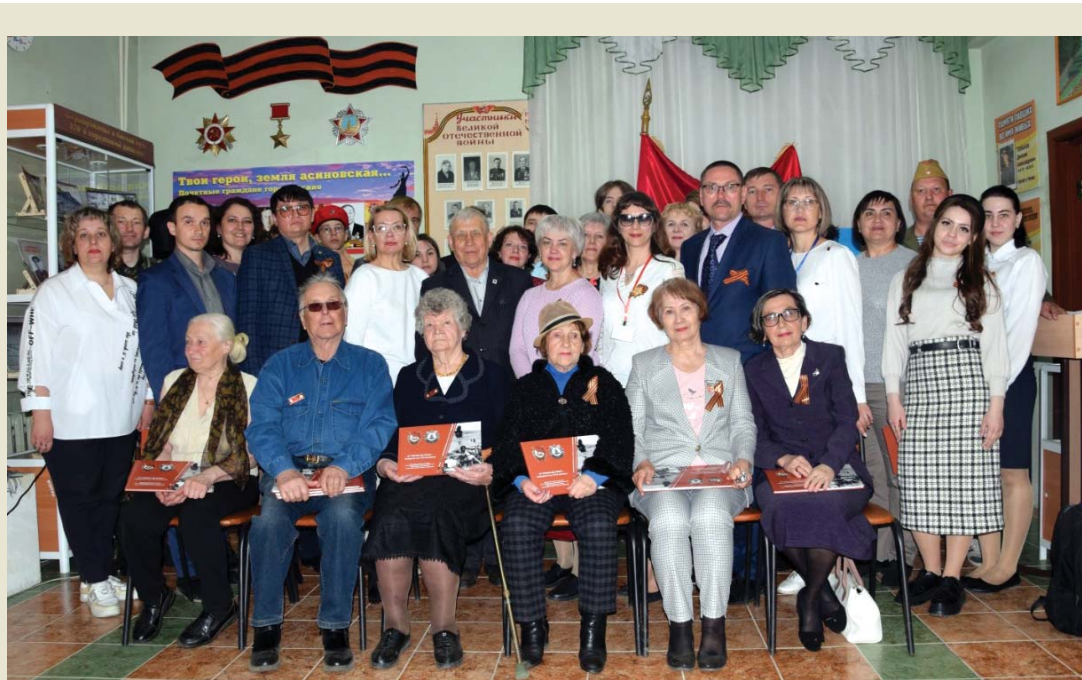
Участники памятного события в честь 100-летия Е.А. Глухих