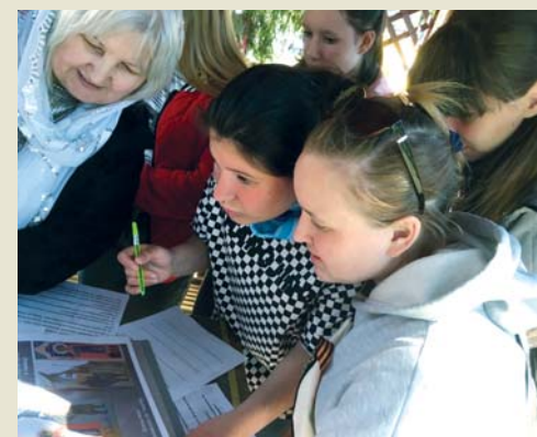
Отвечали, в чём подвиг Георгия Победоносца