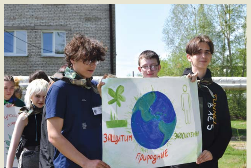
Плакат – действенный агитационный материал