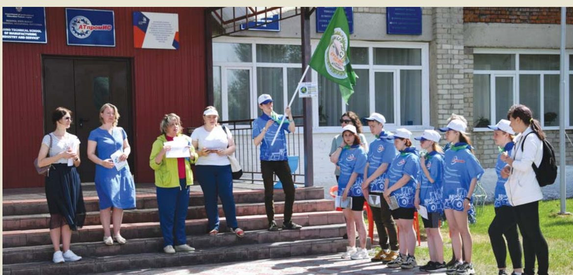
Команда АТпромИС на открытии «Марша»