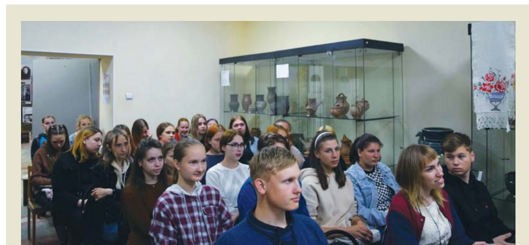
Встречи в музейных залах – это незабываемые уроки об истории края