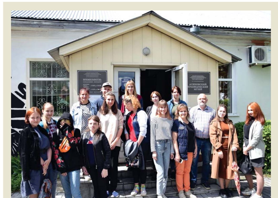
В АРТ-РЕЗИДЕНЦИИ студенты получили советы опытных журналистов

На следующий день визита в Центре культурного развития г. Асино состоялась