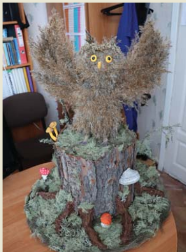
Подделка, Анжелика ЛОБАНОВА