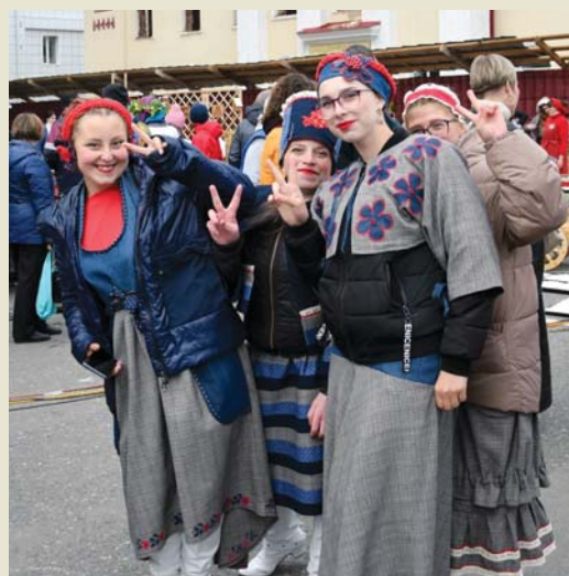
Наряды по сезону к лицу студенткам АТпромИС