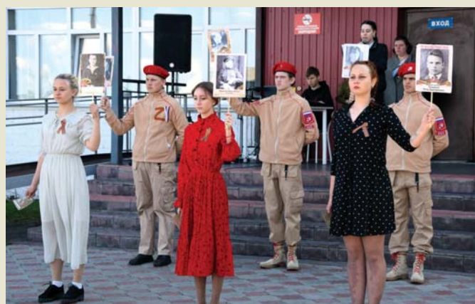
День Победы – праздник всех поколений

Материалы полосы подготовлены Медиа-центром АТпромИС